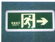
应急灯疏散指示标志B 材质：玻璃、铝合金