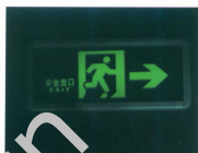
应急灯疏散指示标志C 材质：玻璃、铝合金