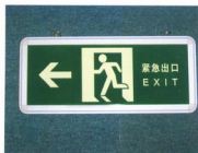
应急灯疏散指示标志A 材质：玻璃、铝合金